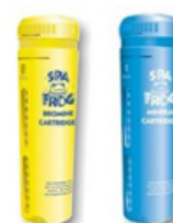
Cartouches Brome et minérales en option

GARANTIES Structure 25 ans Acrylique 10 ans Pièces 2 ans