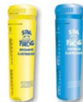
Cartouches Brome et minéraux en option

GARANTIES Structure 25 ans Acrylique 10 ans Pièces 2 ans