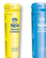
Cartouches Brome et Minéraux en option