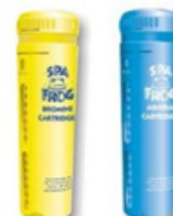
Cartouches Brome et Minéraux en option

GARANTIES Structure 25 ans Acrylique 10 ans Pièces 2 ans