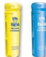
Cartouches Brome et Minéraux en option

GARANTIES Structure 25 ans Acrylique 10 ans Pièces 2 ans